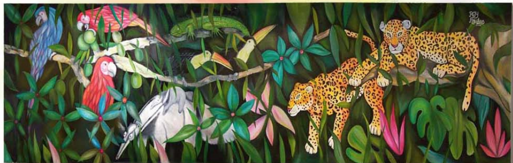
La flora y fauna de Honduras es el tema del mural que Roy pintó en regalo a sus compañeros de ELCA.