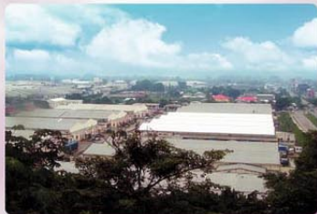
El Parque Industrial Zip Choloma no sólo es la principal fuente de ingresos para esta próspera ciudad sino también para muchas familias a lo largo del Valle de Sula.