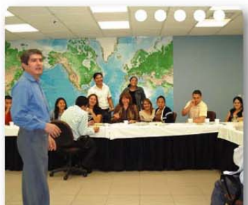
Procinco ofrece variedad de temas en su programa de capacitación y cuenta con un equipo de instructores altamente calificado.

Además, PROCINCO desarrolla programas especiales que lo