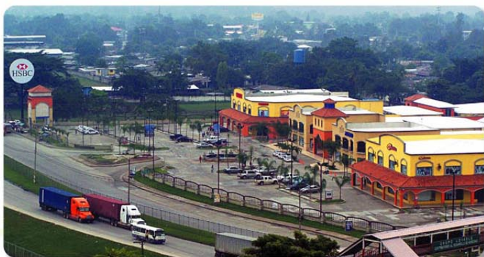
Choloma: Es notable el crecimiento de la ciudad impulsado por el movimiento económico que genera la industria de la Maquila, prueba de ello es la edificación de nuevas tiendas y modernos centros comerciales.

Hace unas dos décadas, eran municipios de escaso crecimiento económico, Choloma arrastraba todavía las secuelas de la destrucción causada por el huracán Fifi en 1974, su comercio lo constituían pequeños negocios de restaurantes, ferreterías y bodegas, también algunas haciendas y lecherías, sobrevivientes del desastre natural ya mencionado.