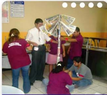
Los ejercicios prácticos del Seminario de Trabajo en Equipo permiten la Integración de los participantes.

De la mano con el Instituto Nacional de Formación Profesional, la Asociación Hondureña de Maquiladores cumple con su misión de "Incrementar la competitividad y productividad de los trabajadores de la Maquila de Honduras", teniendo a PROCINCO como !!! la mano guía que promueve la alta productividad de Honduras!!!