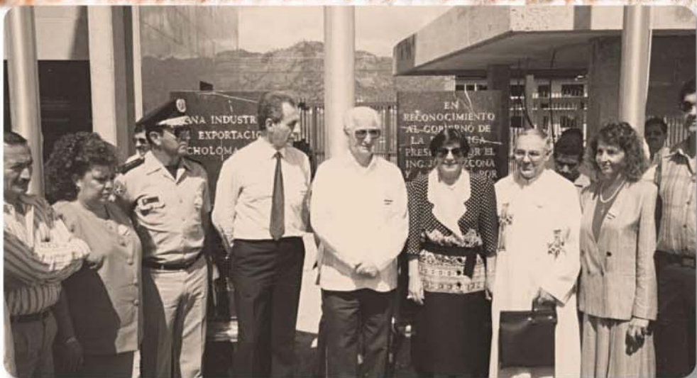
El 20 de Enero de 1990 el ex-presidente de la república Ing. José Simón Azcona Hoyo (ODDG) estuvo presente en la inauguración del primer Parque Industrial privado del país, Zip Choloma. Le acompañan el precursor de la industria de la maquila en Honduras don Juan Canahuati y su esposa doña Tina de Cahanuati y otros invitados especiales.