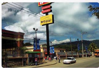
Una estampa de Villanueva, una ciudad que crece a ritmo muy acelerado no sólo en infraestructura y en economía ya que también cada día llegan más y más familias a establecerse en busca de oportunidades.

Los nombres PAXAR, Jockey Honduras, Delta Apparel, RKI Honduras, Fruit Of The Loom, Avent de Honduras, Skips de Honduras y ZIP, son parte del vocabulario de los trabajadores que viven en Villanueva, lo mismo sucede en Choloma, el progreso generado por esta industria salta a la vista, la gran mayoría de su población tiene empleo en la maquila, sus calles arenosas han sido pavimentadas, como resultado del pago de impuestos de Choloma ahora cuenta con bancos, cajeros automáticos, su propio mall, en clara competencia con San Pedro Sula, buscando el desarrollo con trabajo y pasión, los cholomenses y los villanuevenses hoy más que nunca, se sienten orgullosos del auge económico alcanzado por sus municipios, gracias a la oportuna llegada de la maquila.