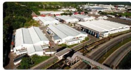
Arriba, una imagen del ayer, antes de la construcción de Zip Choloma. Abajo, se nota el progreso luego de la llegada de la maquila.