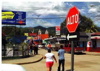
Cada vez son más los inversionistas que ven en Villanueva una fuente inagotable para el comercio.