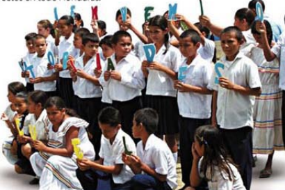
Parte de los escolares beneficiados por esta obra agradecieron el gesto con un bonito detalle.