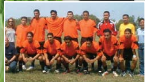
El equipo Avent de Honduras, Campeón del Torneo de Verano 2008. El equipo Gildan Sub-Campeón del Torneo de Verano 2008.