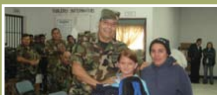
Becas de excelencia académica de los Hijos de los empleados de IMFFAA

Siempre teniendo como prioridad a sus empleados, La industria militar ha creado un comité de Construcción de viviendas, el cual es el encargado de gestionar y conseguir información necesaria en cuanto a los proyectos habitacionales y asimismo brindar el apoyo a sus empleados en la construcción de sus respectivas viviendas, con materiales, mano de obra.