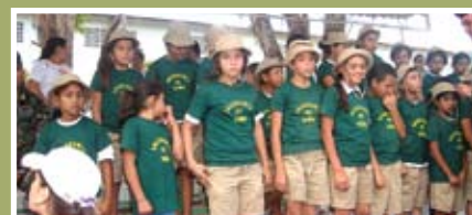
Guardianes del Señor

Uno de los reconocimientos más notorios es su proyección en diferentes programas de Responsabilidad Social Empresarial, en los cuales los beneficiados directos son sus empleados, que en su mayoría también constituyen los habitantes de esa comunidad.