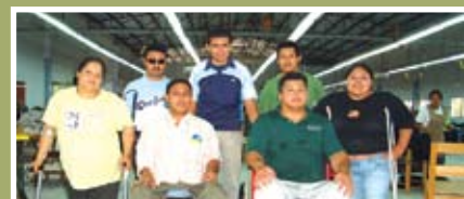
Discapacitados, piezas fundamentales en grupo de empleados de IMFFAA

Los niños de este programa son recibidos cada domingo por voluntarios servidores del IMFFAA en las instalaciones del batallón y para iniciar su jornada son atendidos con un sustentable alimento que consiste en proporcionarles a través del programa Educativo Bíblico Implementado por las iglesias Brigadas de Amor Cristiano todos los domingos, merienda a mas de 400 niños, con un menú variado y muy nutritivo. Para dicha actividad, se cuenta con un presupuesto asignado y los resultados obtenidos hasta la fecha han sido muy satisfactorios.