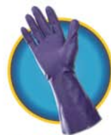
KleenGuard*G80 Nitrilo Morado

Úselos por su seguridad. Prefiéralos por comodidad.