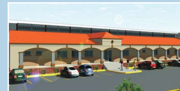
Así se verá la planta que actualmente esta en construcción y que será ocupada por Manufacturera del Pacífico. Su moderno diseño armoniza con el estilo colonial de Choluteca.

El parque iniciará operaciones en julio del 2008 y contará con una estructura completa que comprenderá: área comercial, industrial, institucional y residencial.