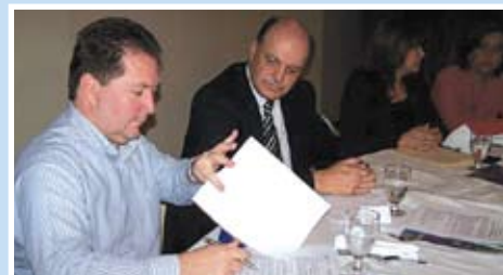
Firma del acuerdo de implementación del programa RAC entre representantes de la AHM y Cumple y Gana.