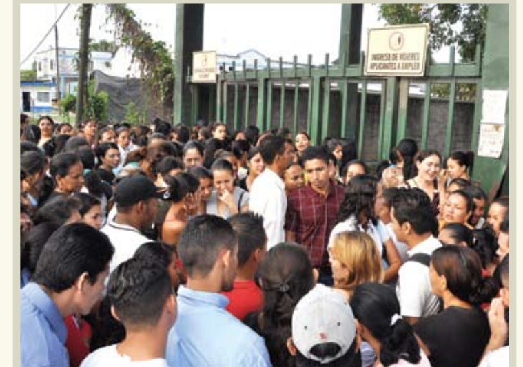
Cientos de hondureños buscan trabajo en la industria con la esperanza de ser empleados. Si Dios te bendicido con conservar tu trabajo... Por tus hijos y tu familia, cuidalo.

Debes cuidar la fuente de trabajo a través de un desempeño esmerado de tus labores, cuidando la calidad por sobre todas las cosas, recordando que detrás nuestro, hay personas que dependen de nosotros, hijos, hijas, padres o esposas, pues la industria maquiladora da empleo a miles de cabezas de familias, hombres y mujeres.