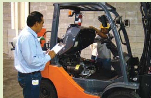
Momentos en que eran evaluados los operadores de carga de la empresa Caracol Knits.