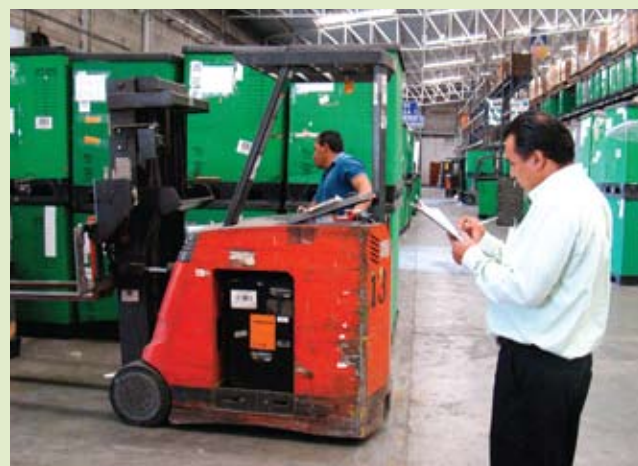
Parte de la evaluación práctica efectuada a los operadores de montacargas de la empresa Fruit of the Loom.