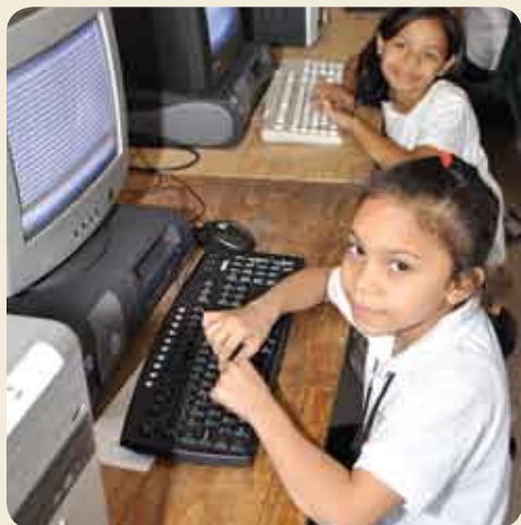
Laboratorio de computación donde los alumnos se familiarizan con la tecnología.