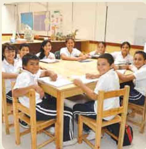
Alumnos de Asemos posan orgullosamente para el lente de ZIPodemos.