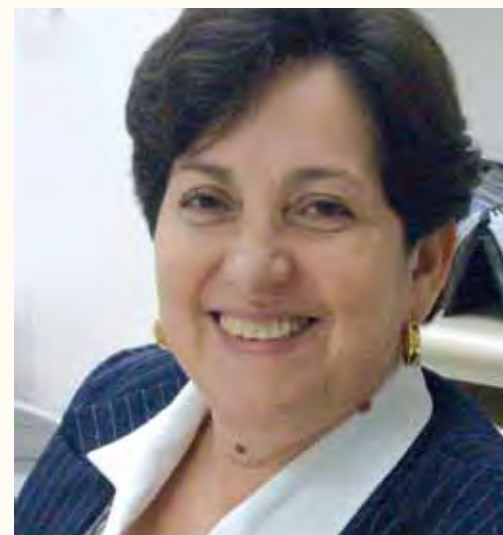
Otra verdadera historia de éxito en la industria