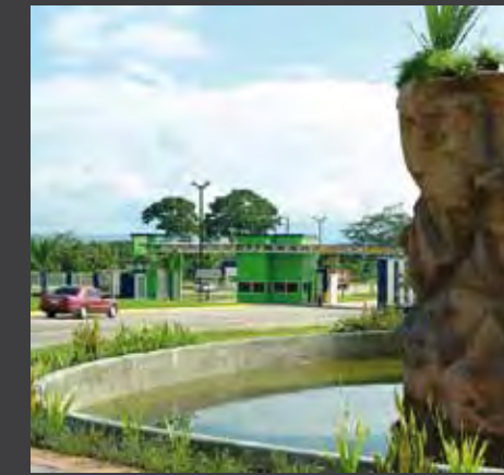
Honduras cuenta con 17 parques industriales afiliados a la Asociación Hondureña de Maquiladores los cuales se han convertido en el imán de inversión y desarrollo socio económico del país a través de la generación masiva de empleo.