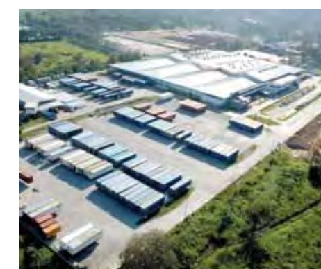
Honduras cuenta con parques industriales modernos que albergan la inversión y generan miles de empleos.