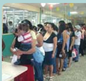
Durante la feria se atendió a los familiares y empleados de la planta con diversos especialistas.