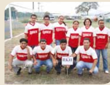
Representantes de RKH