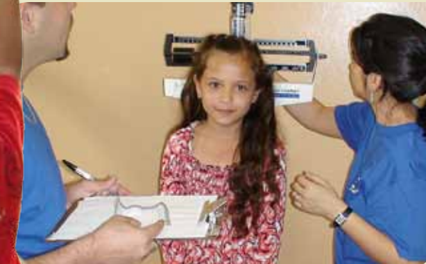
Los voluntarios internos realizaron una excelente labor, atendiendo a los cientos de personas que llegaron a la feria en busca de salud.