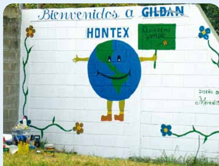
Meredith Dubón Primer lugar Hontex