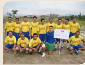
Equipo de Green Valley