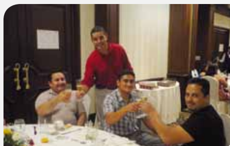
Los jefes y gerentes de Jockey de Honduras acompañaron durante el almuerzo a los homenajeados.

En el primer trimestre de este año, un grupo de empleados de Jockey de Honduras fue agasajado por arribar a su 10 años de labores, quienes fueron los homenajeados en una elegante reunión en el Hotel Hilton Princess de SPS, donde se ofreció un almuerzo en su honor y se les entregó un anillo de oro como obsequio tradicional en su décimo aniversario.