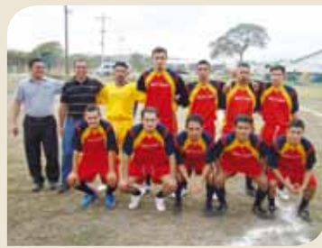
Equipo de SIMTEX