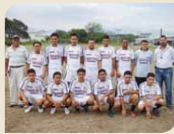
Equipo de AKH