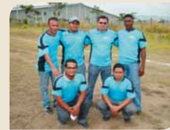
Representantes de Envasa

Será un torneo de 2 vueltas con la participación de 8 equipos de las empresas Green Valley, AKH, Tesa, FCI, RKH, Simtex, Ceiba Textil, y Envasa. Todos con la sed de convertirse en los "Campeones" y que por cierto el equipo ganador que ocupará el primer lugar tendrá como premio un hermoso trofeo y el uniforme para todo el equipo de la selección de Brasil. El segundo Lugar recibirá como premio el uniforme de la selección de Honduras y un trofeo así como un tercer premio al tercer lugar que recibirán el uniforme de la selección de Argentina.