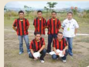
Representantes de FCI