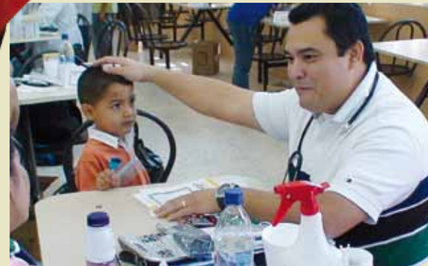
Médicos voluntarios y los médicos de la compañía atendieron a los pacientes de las zonas de Villanueva y El Progreso.