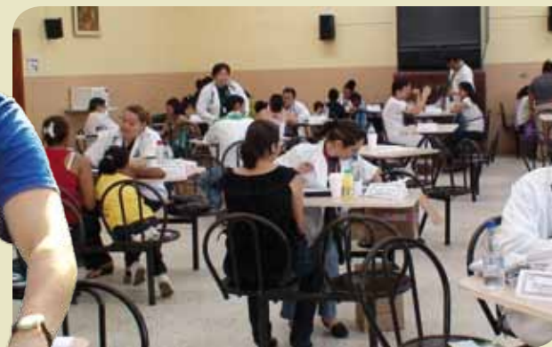
Un aspecto general del área de consulta general, donde fueron atendidos cientos de pacientes por médicos con alto espíritu de compromiso social.