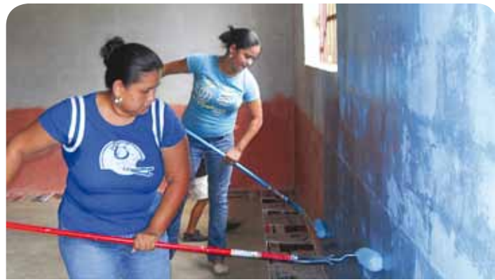
Los asociados interplanta no sólo pintaron las paredes de las aulas escolares, sino también la decoraron para alegría de los niños.

En otra actividad, colaboradores de la planta Confecciones Dos Caminos donaron una significativa cantidad de libros a los niños de la Escuela "Isolina Anariba" de Villanueva. Los ejemplares fueron recolectados entre los mismos empleados.