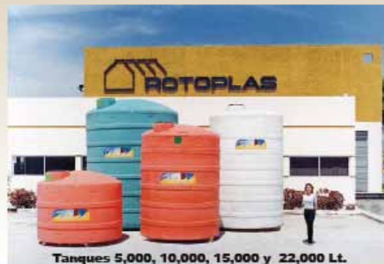
Tanques 5,000, 10,000, 15,000 y 22,000 Lt.

Servicios de Ingeniería Hidráulica y Construcción