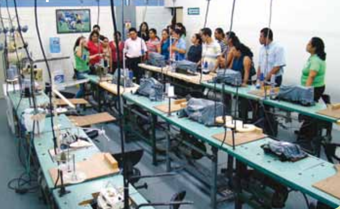
Empleados, ejecutivos e invitados haciendo el recorrido por el laboratorio del nuevo centro educativo el día de la inauguración.