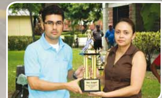
El Tercer lugar lo obtuvo Petrallex.