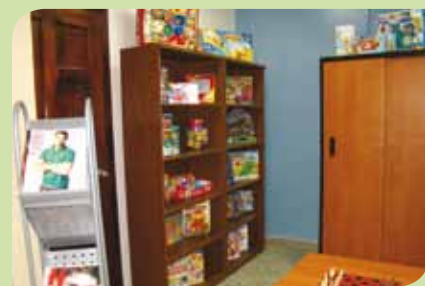
Librería de material educativo para los hijos de los empleados.