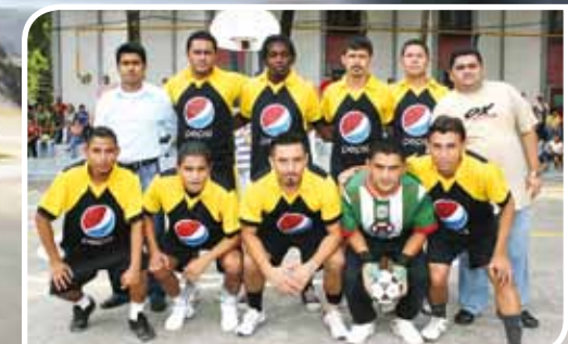
El Segundo Lugar lo obtuvo Confecciones Dos Caminos.