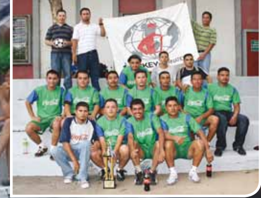
Primer Lugar lo obtuvo Jockey de Honduras Planta de Corte.

La gran final se jugó entre los equipos de las empresas de Confecciones Dos Caminos Vrs. Jockey de Honduras, siendo el Campeón del Torneo Jockey de Honduras, quienes recibieron los premios en efectivo, uniformes y trofeo que les acreditaba como los grandes ganadores de este torneo de fútbol.