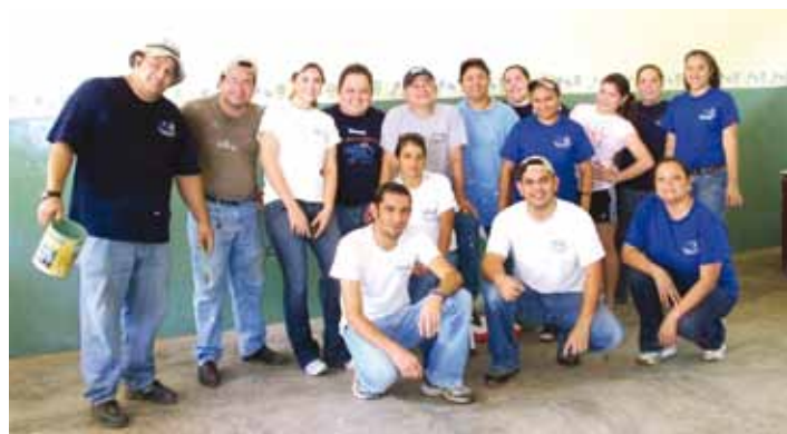
Grupo de colaboradores voluntarios interplanta, luego de finalizar una de sus jornadas de trabajo.