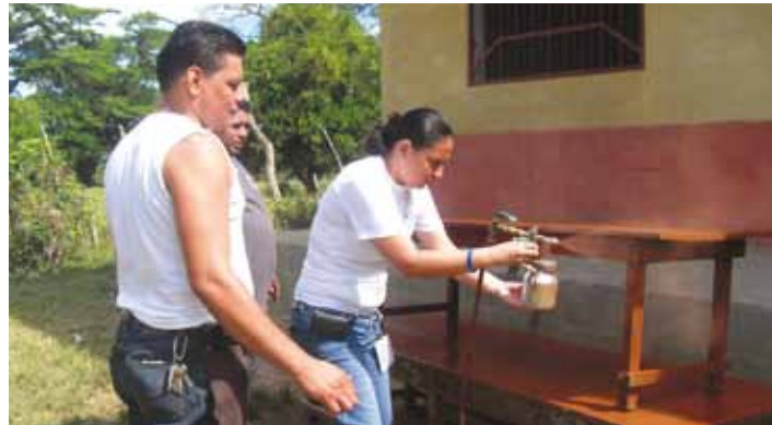
Asociados de la Tela Plant, captados mientras trabajaban en la mejora del mobiliario.