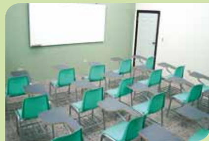
Sala de capacitación del centro educativo.