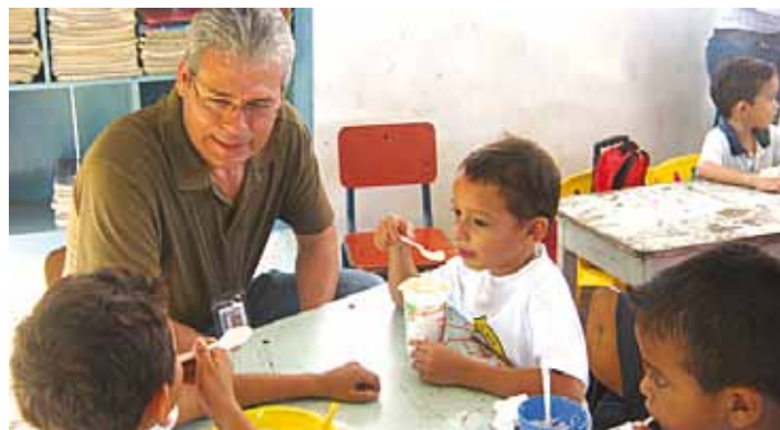
Voluntarios de la Planta Roatán departieron con los niños de la Escuela "Proheco" a quienes llevaron una deliciosa merienda escolar.