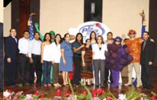
Ⓐ Empleados de Jerzees Buena Vista luego de ser homenajeados.