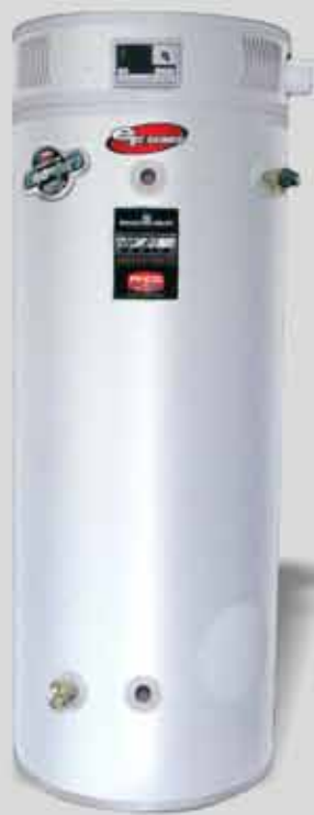
Calentadores de Agua

desde 1/2 hasta 2 H.P. con tanques desde 6 hasta 120 galones