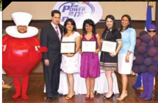
Ⓐ Nuevos socios del Club de Fundadores de la Planta Tela.

Además, se hizo un reconocimiento especial a 85 asociados que cumplieron sus 15 años de trabajo, y a tres asociados, con 20 años de labor. Todos los invitados disfrutaron de un exquisito almuerzo, en un ambiente de camaradería y mucha alegría.