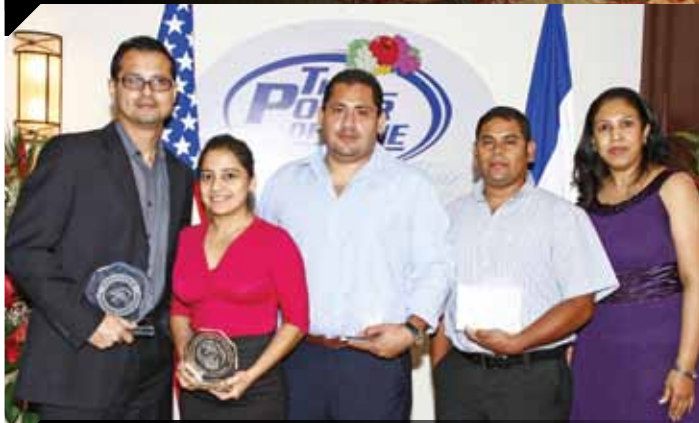
Ⓐ Asociados premiados de Desoto Knits en compañía de su Gerente de planta y su Gerente de Recursos Humanos.