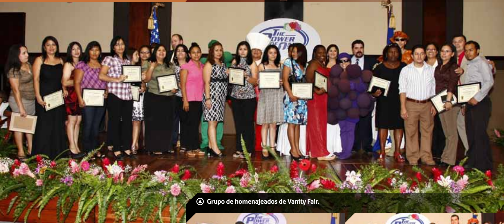
Ⓐ Grupo de homenajeados de Vanity Fair.