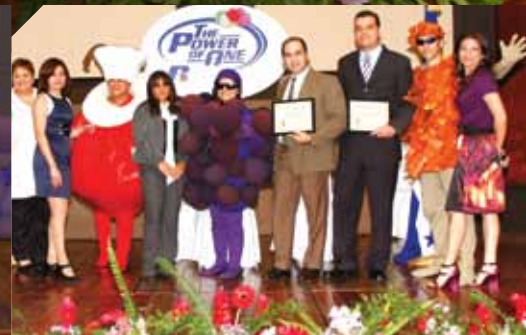
Ⓐ Los personajes de "Los Chicos Fruit" posan acompañados de los asociados interplanta.