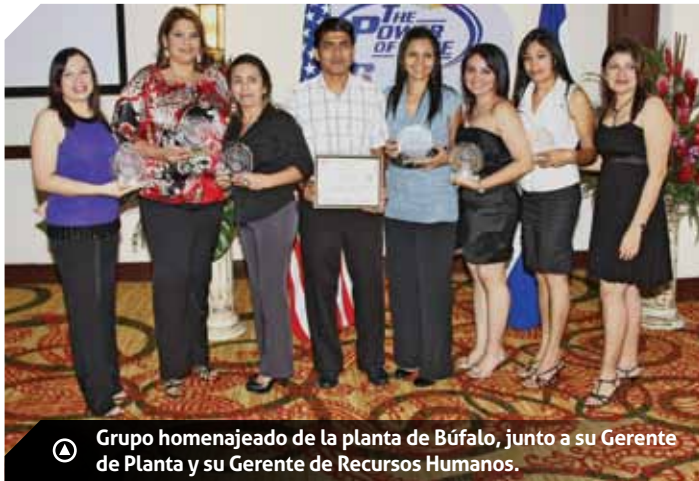
Ⓐ Grupo homenajeado de la planta de Búfalo, junto a su Gerente de Planta y su Gerente de Recursos Humanos.