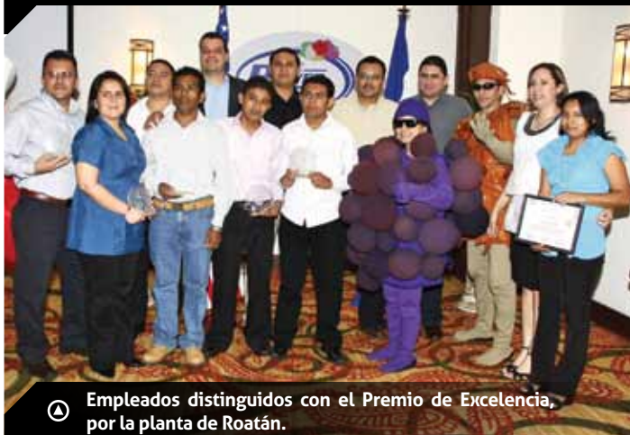
Ⓐ Empleados distinguidos con el Premio de Excelencia, por la planta de Roatán.