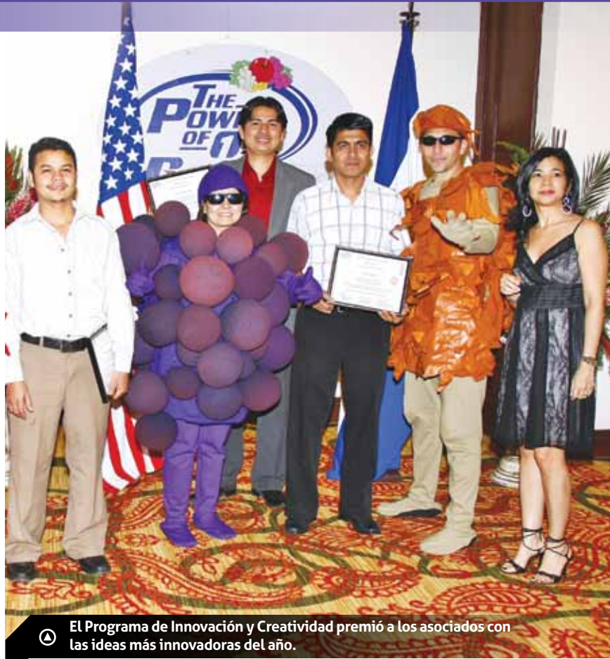
Ⓐ El Programa de Innovación y Creatividad premió a los asociados con las ideas más innovadoras del año.