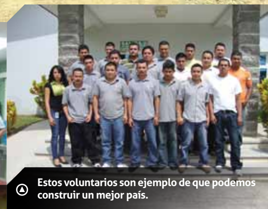
Los voluntarios interplanta, han realizado varios proyectos de mejora en la Escuela Pedro Nuño, de El Calán, Villanueva.