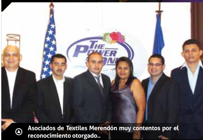
Ⓐ Asociados de Textiles Merendón muy contentos por el reconocimiento otorgado..