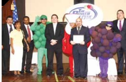
Ⓐ Socios del Club de Fundadores de Jerzees Nuevo Día.