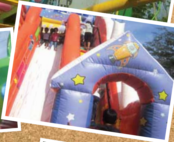
Dickies de Honduras