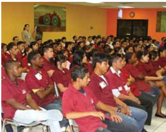
▲ Grupo que graduó Proempleo en la empresa Lear

La Secretaría de Trabajo y Seguridad Social, a través de su programa PROEMPLEO y con el apoyo de la Asociación Hondureña de Maquiladores, graduaron este año en San Pedro Sula, a 1,041 jóvenes en edad laboral que pasan a integrar la población empleada del país.