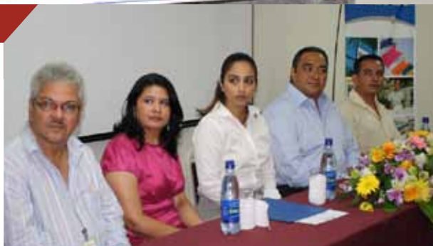
▲ Mesa principal que presidió los actos de la donación que Gildan hizo al IPC.