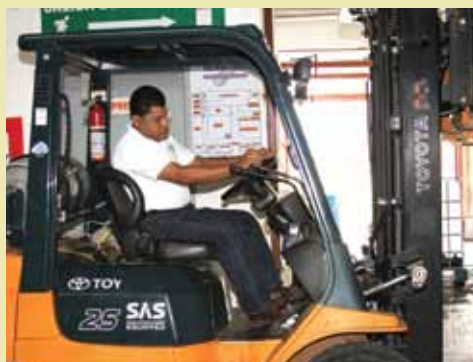
Es completo... hasta el montacarga puede manejar.