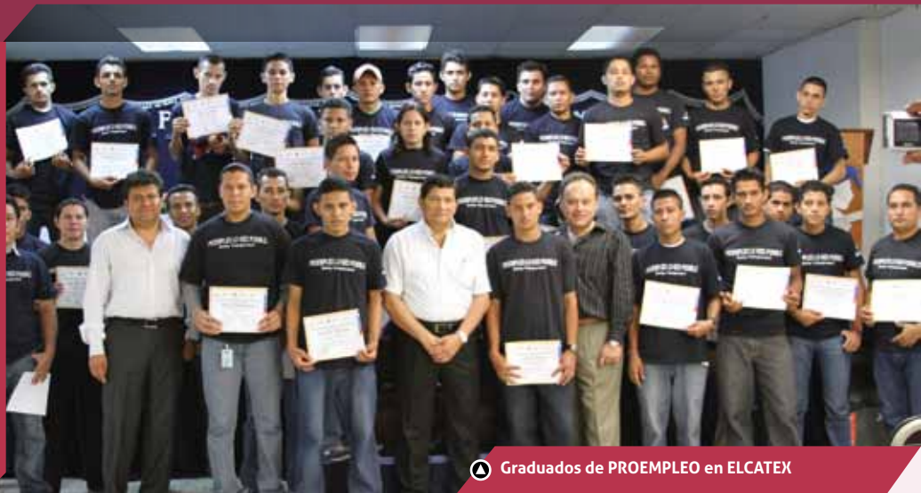
▲ Graduados de PROEMPLEO en ELCATEX