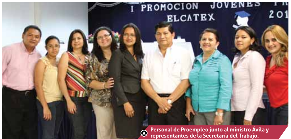
▲ Personal de Proempleo junto al ministro Ávila y representantes de la Secretaría del Trabajo.

Entre los beneficios para estos jóvenes se encuentra: Un bono por Lps. 1,927.30 mensuales para que cubran sus costos de transporte mientras se trasladan a las instalaciones de la empresa; Un seguro contra accidentes durante todo su período de entrenamiento; la oportunidad de mejorar sus competencias a través del entrenamiento y obtener una oferta laboral al finalizar el mismo, así como un diploma de participación.