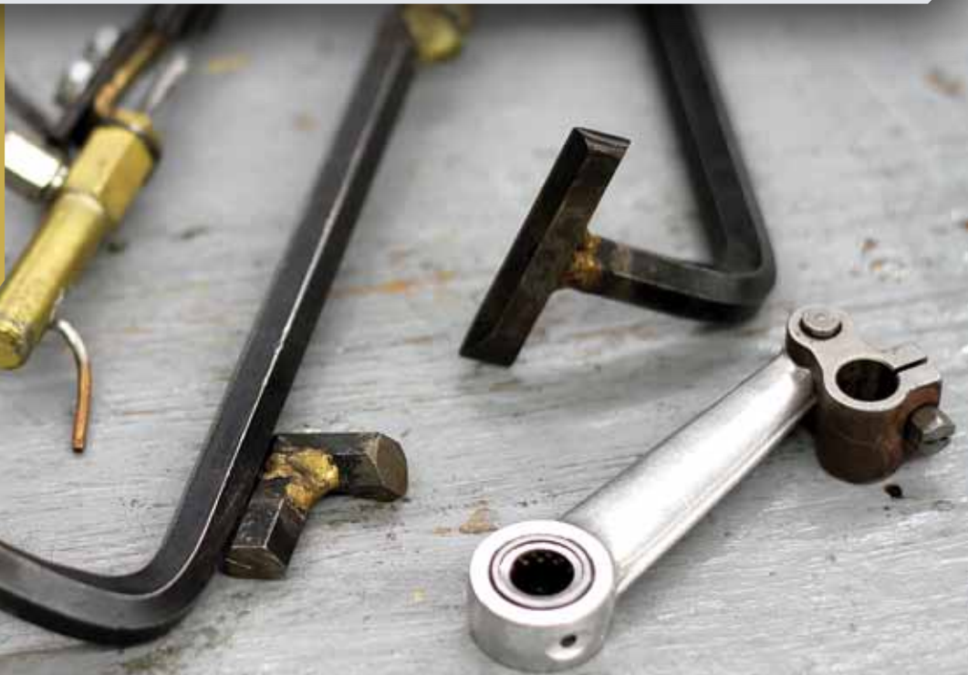
Estas son algunas de las piezas que han inventado.