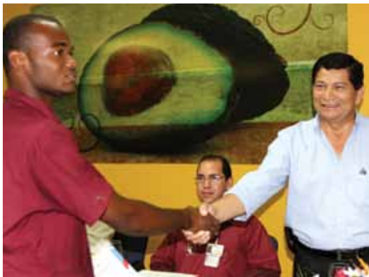
▲ El ministro del Trabajo, Felícito Ávila, entrega diploma a uno de los graduados.