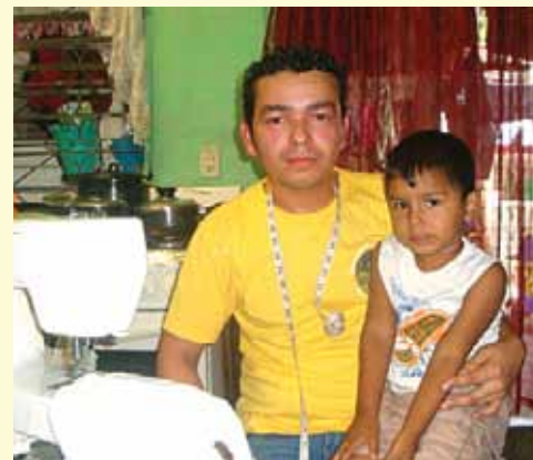
Junto con su pequeño hijo, en su casa.