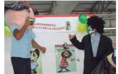
Catrachito Limpiador y Mr. Sucio fueron los personajes de la campaña.