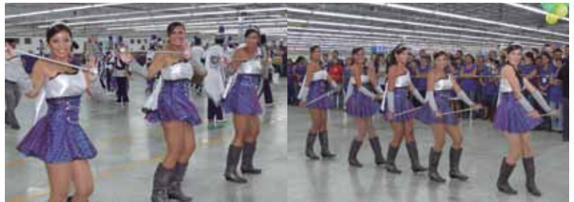
Las bellas palillonas del instituto Manantial de Valores.