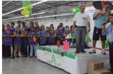
Los líderes de la campaña 6's presentaron la campaña a los operarios de Dickies.