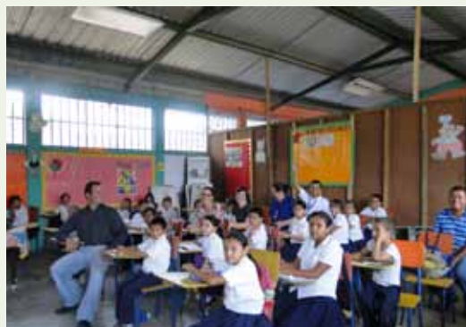
Asociados compartiendo con los niños de la escuela ya con las lámparas instaladas.