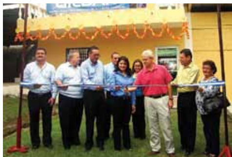
Representantes de Gildan asistieron al corte de cinta en el centro técnico Mario Ugarte.

Demostrando nuevamente su compromiso con las comunidades donde opera, Gildan inauguró dos aulas en el Centro Técnico Vocacional Mario Ugarte, que fortalecerán la educación técnica del municipio de Choloma. Las aulas están destinadas para que los más de 300 alumnos puedan recibir clases de inglés y disfrutar de lecciones virtuales.