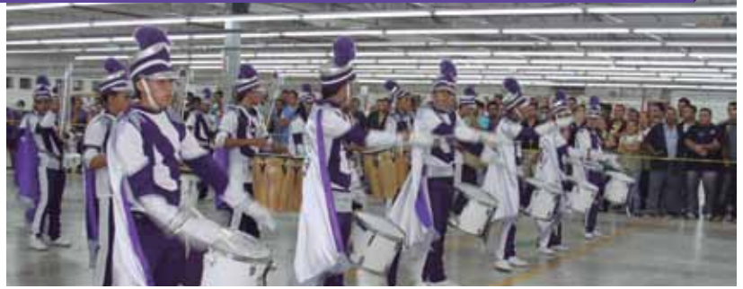
La banda del instituto cholomeño animó el lanzamiento de la campaña de las 6's.

Las premiaciones se realizaron el primer día de cada turno donde los personajes colocaron banderines según los resultados obtenidos.