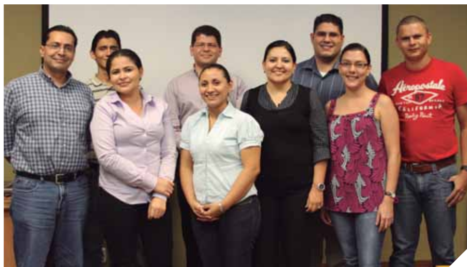
Profesionales asignados por la AHM a las empresas participantes.