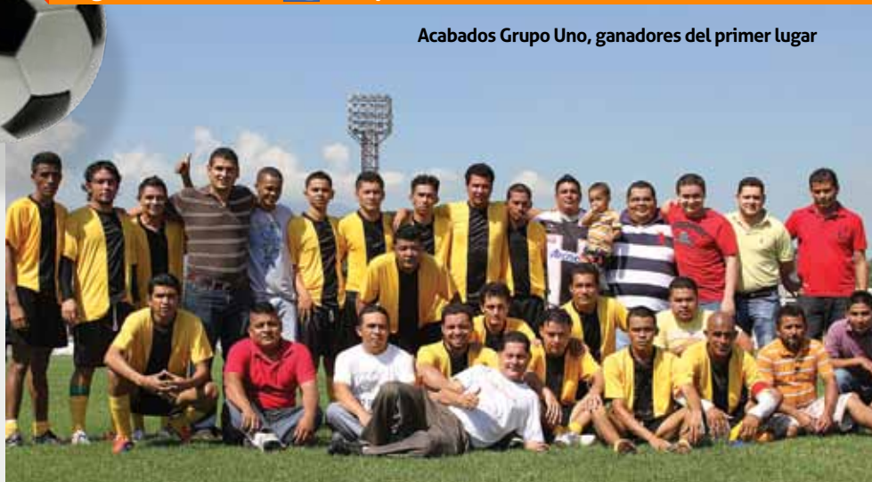
Acabados Grupo Uno, ganadores del primer lugar