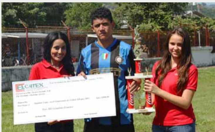
Representante de "Corte" recibe los premios por el segundo lugar