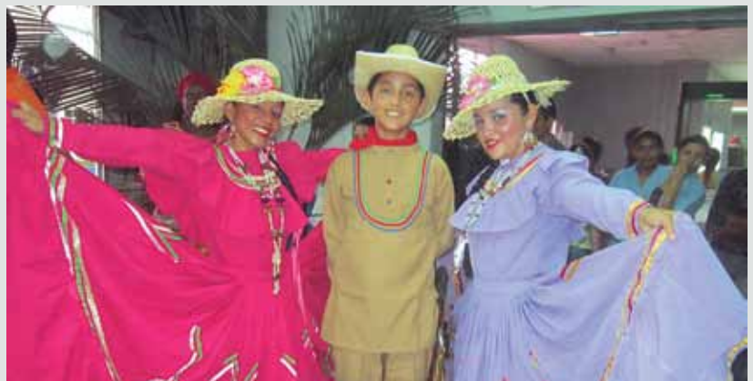
El cuadro de danza de La Lima ofreció una presentación en el festival folclórico.