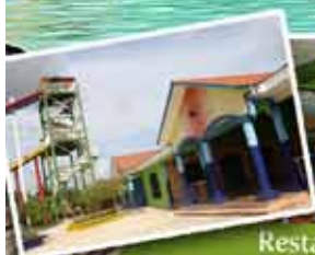
Restaurante El Cañal