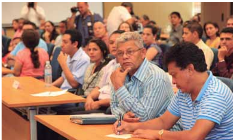
Representantes de centrales obreras asistieron al evento.

Zelaya reiteró que el compromiso del IHSS es garantizar la integración de trabajadores con alguna discapacidad a través de la consolidación de un programa de reinserción laboral para evaluar las aptitudes, habilidades y destrezas del trabajador, dándole seguimiento hasta su incorporación total a su trabajo y a la sociedad.