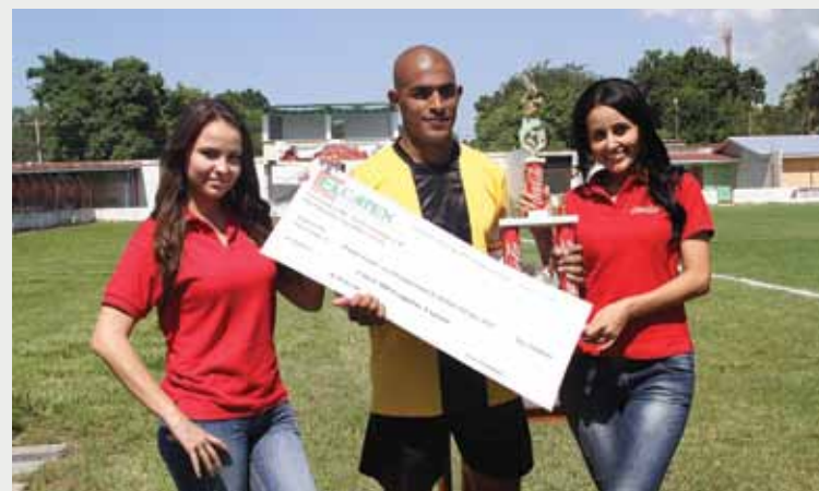
El capitán de "Acabados" recibe los premios por el primer lugar