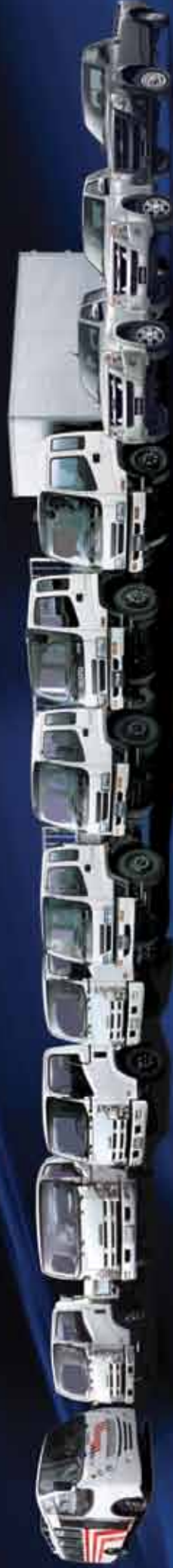
Autobuses 30 pasajeros