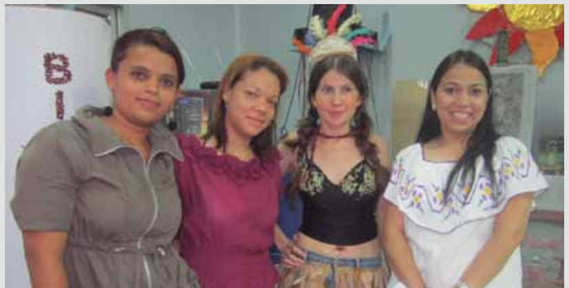
Personal de Empire Electronics celebró una fiesta típica.

Los empleados compartieron y participaron en este festival lleno de alegría. En Empire Electronics no sólo se trabaja, también se disfruta con actividades donde la creatividad y el ingenio de los operadores son los protagonistas.