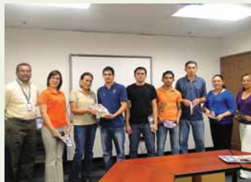
Momentos en se entrega el donativo.