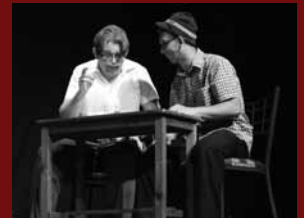
2011: El juego