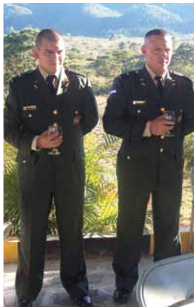
Los nuevos Subtenientes Auxiliares de Mantenimiento.