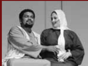
2008: El viaje