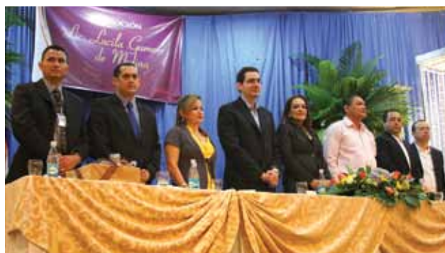
Honorable mesa principal durante los actos de graduación.

HBI Honduras celebró a lo grande la graduación de 324 de sus trabajadores como Bachilleres en Ciencias y Letras, quienes son beneficiarios del Programa Educativo que HBI Honduras implementó como parte de su estrategia de Responsabilidad Social Empresarial para promover entre sus colaboradores la preparación académica.