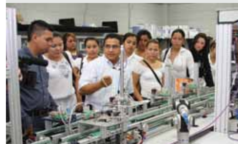
Empleados de Gildan recorren un moderno laboratorio en las instalaciones de la UTH.

Para Gildan el presente acuerdo no representa la primera vez que realiza una alianza de cooperación con otras instituciones a fin de ofrecer oportunidades de educación y desarrollo a sus colaboradores. En 2011 firmó con la Secretaría de Educación un convenio de colaboración para brindar estudios secundarios a través del programa Educatodos.