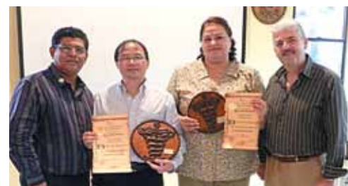
Momento en que se premiaba a los doctores del SME con el "Eskulapio 2011".