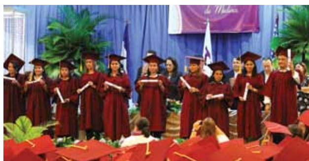
Algunos de los graduados al recibir sus títulos.