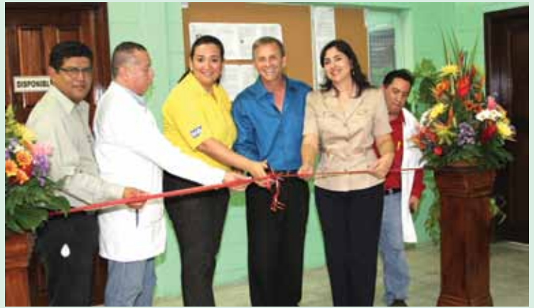
Momento en que representantes de DSA, IHSS, AHM, daban por inaugurada oficialmente la clínica.

Al finalizar el programa los asistentes recorrieron las instalaciones de la clínica y degustaron exquisitos bocadillos celebrando tan importante acontecimiento.