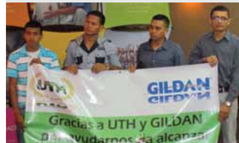
Parte del grupo de colaboradores beneficiados.