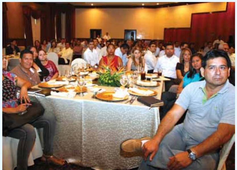
Representates de los trabajadores también fueron parte de este evento.