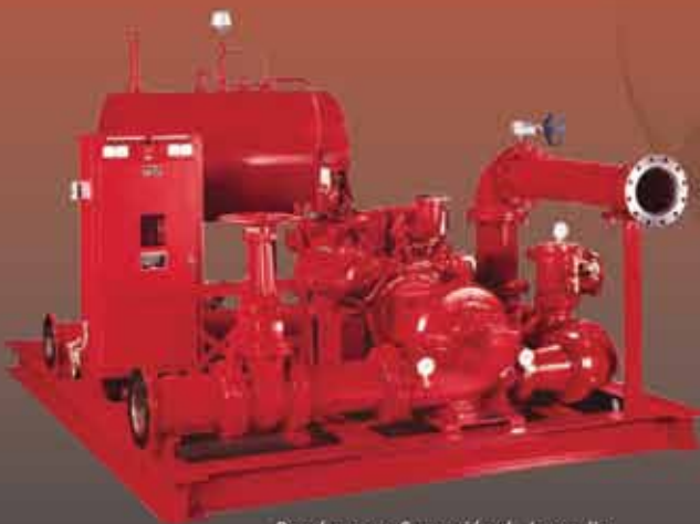
Bomba para Supresión de Incendio