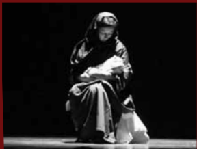
2007: No fue una noche de paz