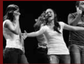
2010: El milagro