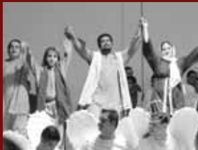
2008: El viaje