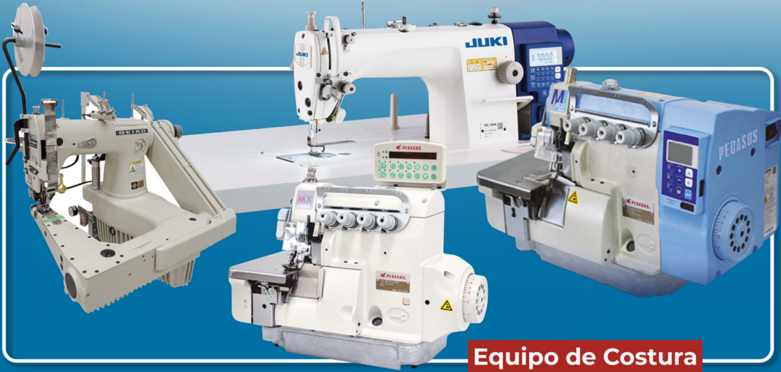
Equipo de Costura

Sirviendo a la Industria de la Confección en Centroamérica y el Caribe desde 1971