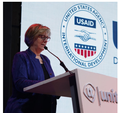
Laura Dogu, Embajadora de Estados Unidos en Honduras

“El programa “Hilando Oportunidades” es un gran ejemplo del trabajo entre la industria maquiladora, el Gobierno de Honduras, el Gobierno de USA y la academia. El programa da oportunidades de crecimiento a través de la educación técnica textil a hondureños en Honduras”.