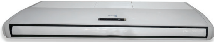
TECHO 5 TON.