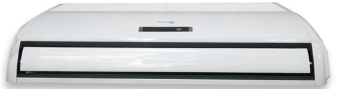
TECHO Inverter 3 TON.