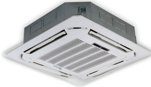
CASSETTE Inverter 3 TON.