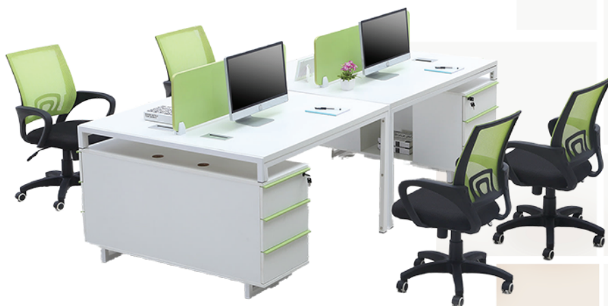
SLIM ESTACION DE TRABAJO 4 PUESTOS C/PEDESTAL OZ-SL-117-12 246 X 120 X 105 CM I-OS155-117-B9TX