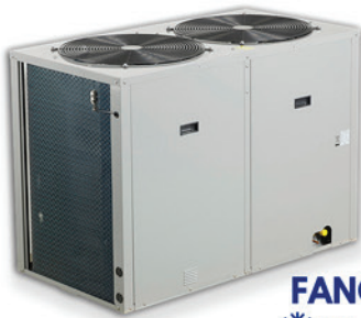
FANCOIL ❄️ 5 A 20 TON ⚡ MONOFÁSICO TRIFÁSICO