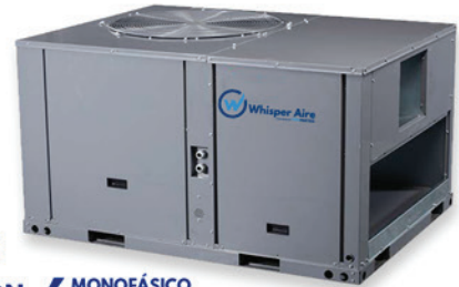
PAQUETE ❄️ 5 A 30 TON ⚡ MONOFÁSICO TRIFÁSICO