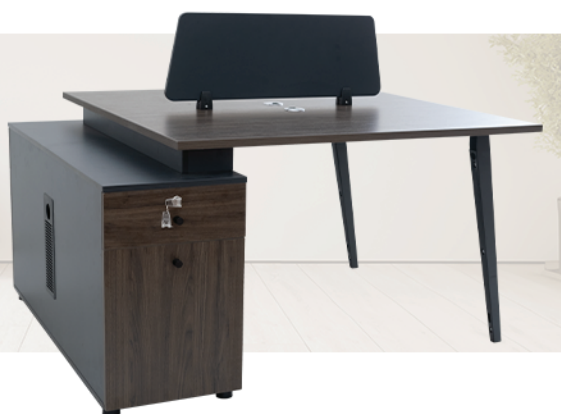
ESTACION DE TRABAJO 2 PUESTOS OZ-9004-14 140 X 120 X 105 CM I-OZ130-002-W4TX