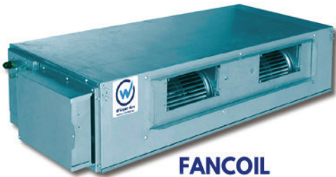
FANCOIL ❄️ 8 A 20 TON ⚡ MONOFÁSICO TRIFÁSICO