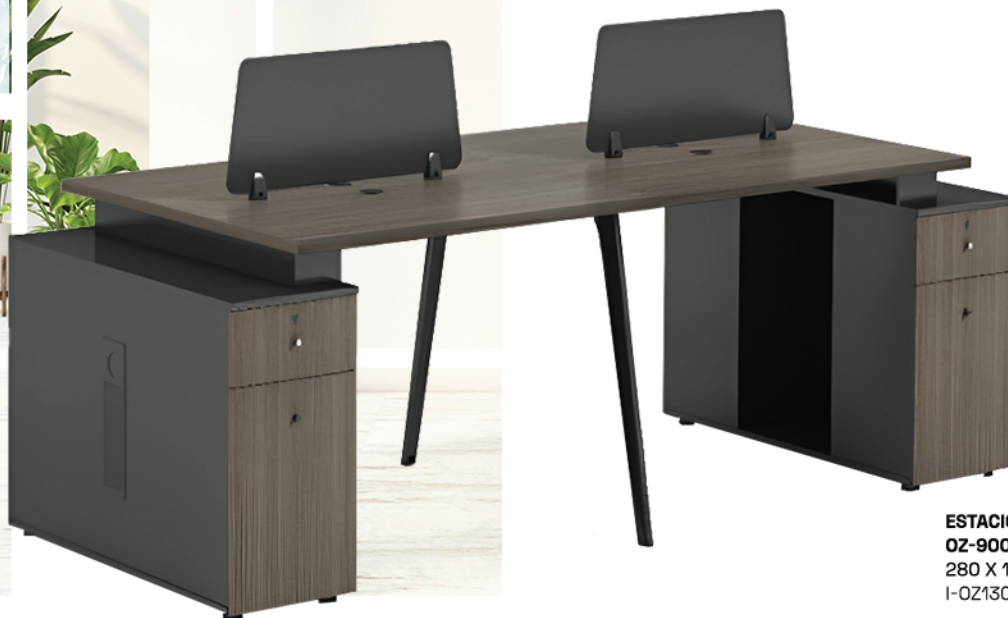
ESTACION DE TRABAJO 4 PUESTOS OZ-9004-28 280 X 120 X 105 CM I-OZ130-003-W4TX

FUNCIONALIDAD, EFICIENCIA EN ESPACIO Y ESTILO PARA TU OFICINA