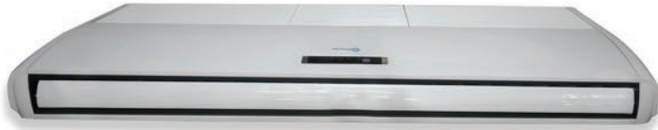
TECHO 5 TON.