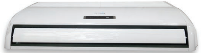
TECHO Inverter 3 TON.