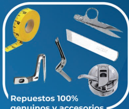
Repuestos 100% genuinos y accesorios