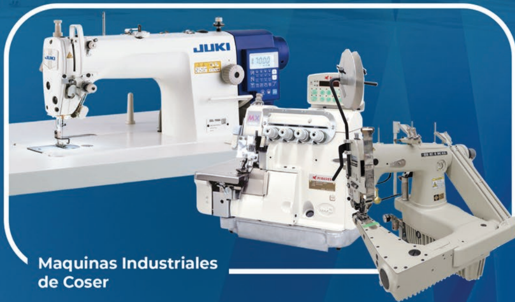
Maquinas Industriales de Coser

Sirviendo a la Industria de la Confección en Centroamérica y el Caribe desde 1971.