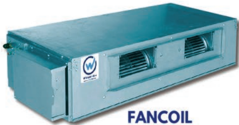
FANCOIL ❄️ 8 A 20 TON ⚡ MONOFÁSICO TRIFÁSICO