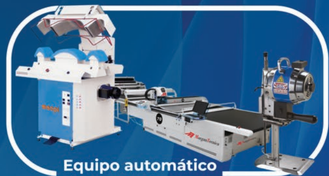
Equipo automático de corte y acabado.

Miembros de: spesa Sewn Products Equipment & Suppliers of the Americas