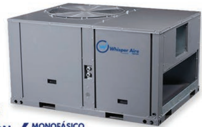
PAQUETE ❄️ 5 A 30 TON ⚡ MONOFÁSICO TRIFÁSICO